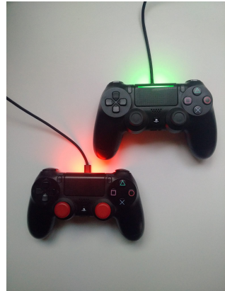
Rysunek: Pady do PS4.