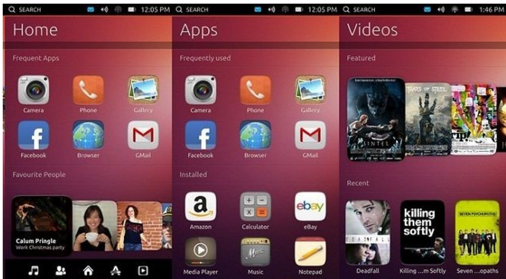
Rysunek: ubuntu touch