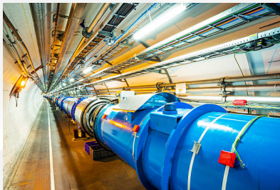
Figure: Large Hadron Collider in CERN

Scientific Linux został nawet załadowany do systemów na Międzynarodowej Stacji Kosmicznej.